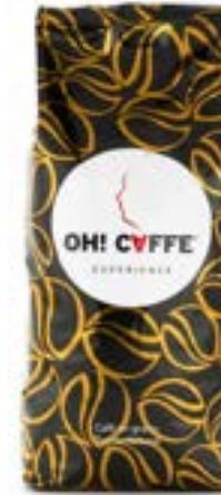
GOLD CLUB Café natural 100% arábica

Un blend 100 % Arábica, afable, aterciopelado y perfecto servido en taza grande.