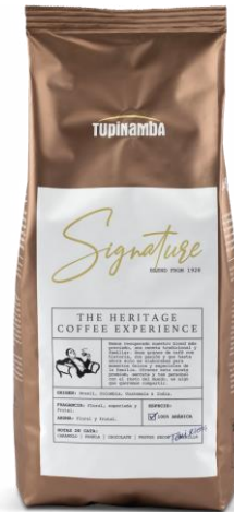
SIGNATURE Café natural 100% arábica

Una receta tradicional y familiar de 1928, firmada por Toni Riera, que durante años formó parte de la intimidad. Un magnífico blend procedente de las mejores plantaciones del mundo: Brasil, Colombia, Guatemala e India.