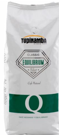
EQUILIBRIUM Café natural

El equilibrio perfecto de las distintas variedades que componen este café caracterizan a Tupinamba Equilibrium. Un café con fuerza, persistencia en boca, con cuerpo completo y crema densa.