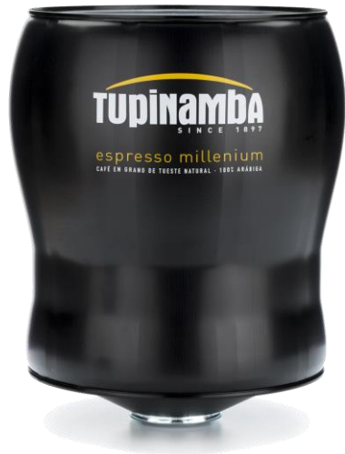
LATA CAFÉ MILLENIUM Café natural 100% arábica

Es un café seleccionado en las más apreciadas plantaciones del mundo, para los que buscan la máxima calidad. Un producto ideal para gourmets, conocedores y amantes del café espresso.