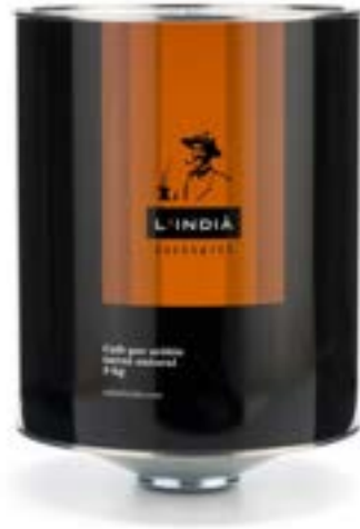
LATA L'INDIÀ Café natural 100% arábica

Es un café seleccionado en las más apreciadas plantaciones del mundo, para los que buscan la máxima calidad. Un producto ideal para gourmets, conocedores y amantes del café espresso.