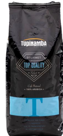
TOP QUALITY Café natural 100% arábica

Blend 100 % Arábica, hecho de los mejores granos de café centro americanos: afable, aromático y cremoso.