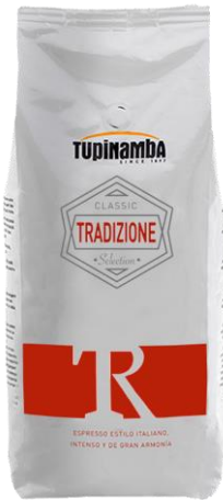
TRADIZIONE Café NATURAL con un porcentaje de torrefacto

Café Tupinamba Tradizione es una mezcla de cafés naturales y torrefactos. Un café con crema, cuerpo y sabor intenso.