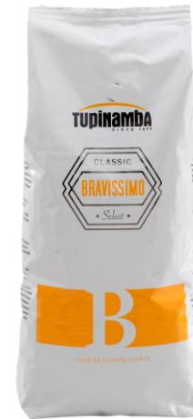
BRAVISSIMO Café natural y torrefacto

Café Tupinamba Bravissimo es una mezcla de cafés naturales y torrefactos. Destaca por su fuerza, gran cuerpo y crema densa y oscura.