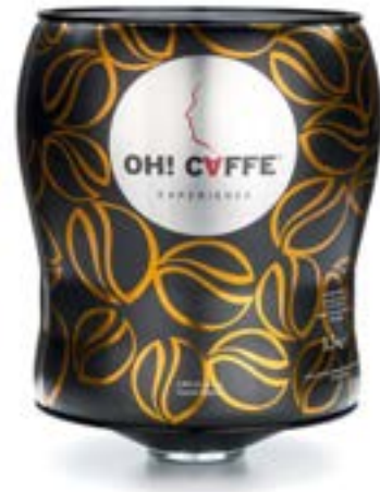
LATA OH CAFFE Café natural 100% arábica

Es un café seleccionado en las más apreciadas plantaciones del mundo, para los que buscan la máxima calidad. Un producto ideal para gourmets, conocedores y amantes del café espresso.