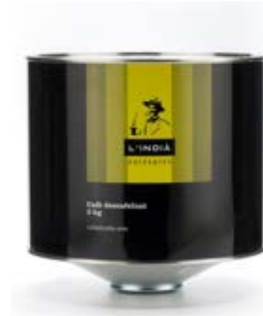
LATA L'INDIÀ DESCAFEINADO Café descafeinado en grano de tueste natural, arábica y robusta

Todo el sabor, con cuerpo, aroma, cremoso y sin cafeína. Descafeinado por proceso natural através de agua, eliminando el 99.9% de cafeína.